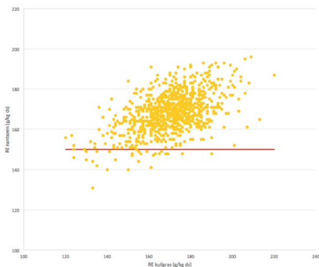
Figuur 3: Het RE gehalte in het rantsoen uitgezet tegen het RE gehalte in voer voor melkveebedrijven op veengrond; de rode lijn geeft het nagestreefde RE niveau in het rantsoen aan (en is geen regressielijn).

Bij een RE gehalte in graskuil van 170 is het nog goed mogelijk om het RE op rantsoen niveau op 150 te sturen. Zie ook de gegevens van de KringloopWijzer op bedrijven op veengrond (Figuur 3). Combinaties van RE gehalten in kuilgras van veel hoger dan 170 en RE van 150 in het rantsoen komen nauwelijks voor.